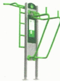
Przykładowy pylon z urządzeniami drabinka – podnoszenie nóg

UWAGA: Przed wykonaniem nawierzchni należy wyznaczyć i wbudować fundamenty betonowe do projektowanych urządzeń.